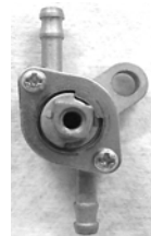
対策品には"ON/OFF マーク"がありません