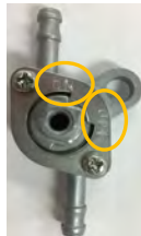
対策前部品には"ON/OFF マーク"があります